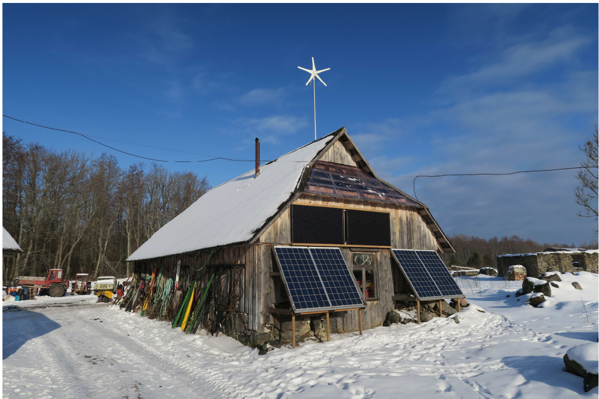
Elstation 2 kW i Storbyn Lilla Rågö.